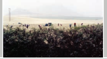
— CAMPO D' ASPARAGI.