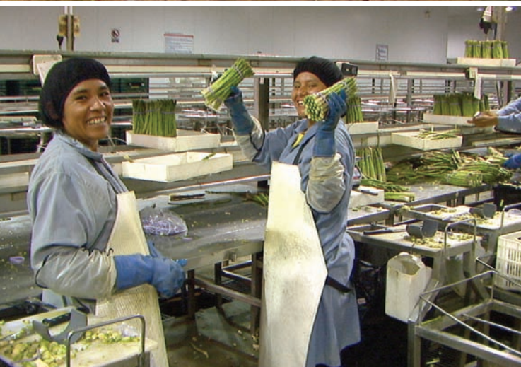
LAVORATRICI NEL CAMPO ED IN FABBRICA