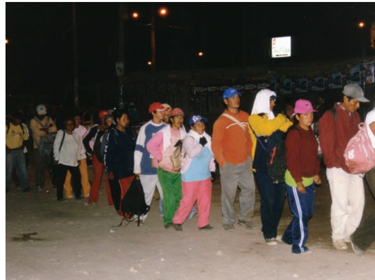
LA MATTINA PRESTO I LAVORATORI PRENDONO L'AUTOBUS PER RECARSÌ AL LAVORO

I tassi di mortalità materna in Perù superano quelli di tutti gli altri paesi sudamericani eccetto la Bolivia – spegnendo le vite di 20.000 donne nel periodo 1990-2005, con conseguenze catastrofiche per le famiglie coinvolte. Tante di queste morti sono provocate dalla mancanza d'istruzione e d'informazione, e dalla carenza di mezzi contraccettivi.