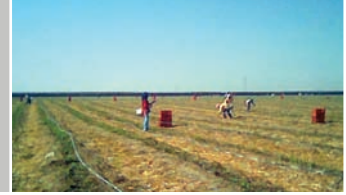
— RACCOLTA D' ASPARAGI